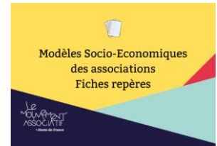
Fiches repères MSE Imahdf.org