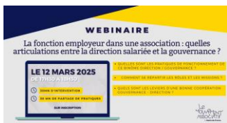
Webinaire fonction employeur Youtube.com/@lemouvementassociatif-haut8103