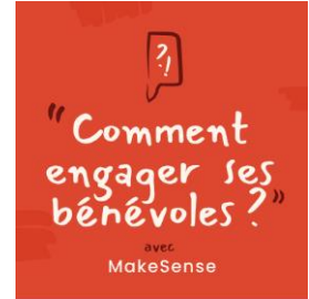
Podcast Question d'Asso – S1 E5 questions-asso.com