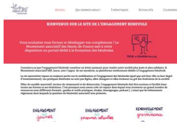
Plateforme du bénévolat en Hauts-de-France benevolat-hautsdefrance.org/