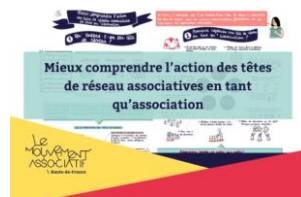
6 raisons de rejoindre une tête de réseau Imahdf.org