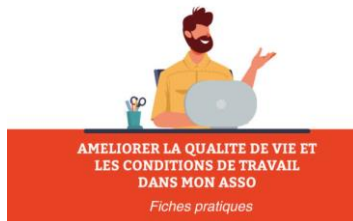
Fiches pratiques QVCT Imahdf.org