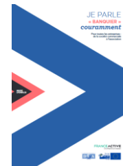
Guide France Active « Je parle bancaire couramment » franceactive.org