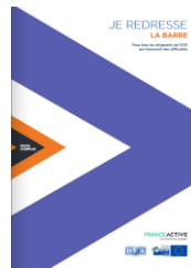
Guide France Active « Je redresse la barre » franceactive.org