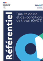
Référentiel de la QVCT anact.fr